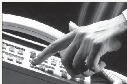
Hacer una llamada telefónica