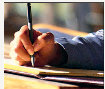
Enviar una carta