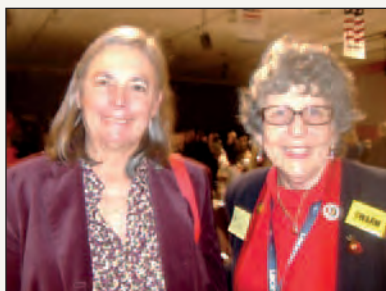
Realizar una visita