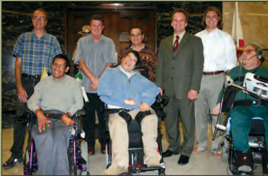
El asambleísta Sam Blakeslee con los miembros de People First of San Luis Obispo

“Como representante electo, es importante que escuche a la gente de mi distrito. Cuando usted se comunica conmigo y comparte su opinión o ideas, estoy en condiciones de representarlo con mayor eficacia. ”